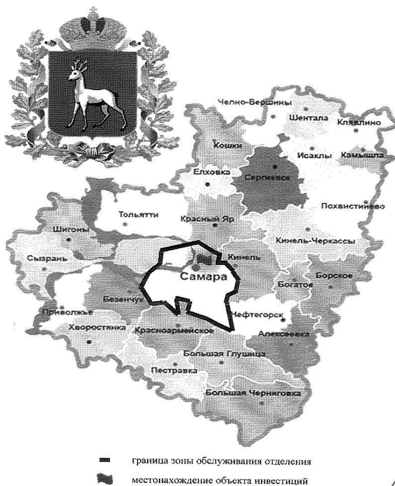
Карта-схема объекта инвестиционного проекта г. Самара

Заместитель директора по техническим вопросам